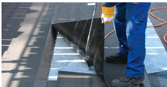
Isola Radonmembran SBS radonmembran og fugtspærre.

Monteres på eller i isolationslaget samt direkte på betongulvet.