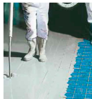
Platon Multi til gulve med afretnings-