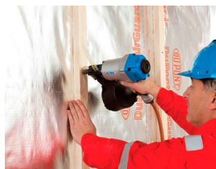
Isola Tyvek® AirGuard Reflective.

Grundmursplader: Platon Xtra Grundmur til effektiv fugtbeskyttelse