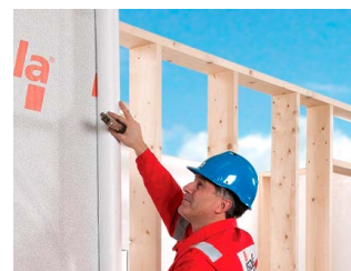
Isola Tyvek® IsoSoft.