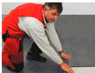
Isola Radonspærre 400.

Isola Radonbrønd 100 / Isola Radonbrønd 500: Specialperforeret rør til ventilation og trykudligning af byggegrunden/kapillarbrydende lag. Benyttes i både nye og eksisterende boliger. Ventilering ca. 100 m 2 / 500 m 2 byggegrund.