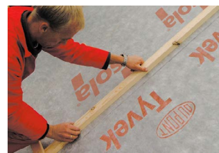
Isola Tyvek® Supro Grid.