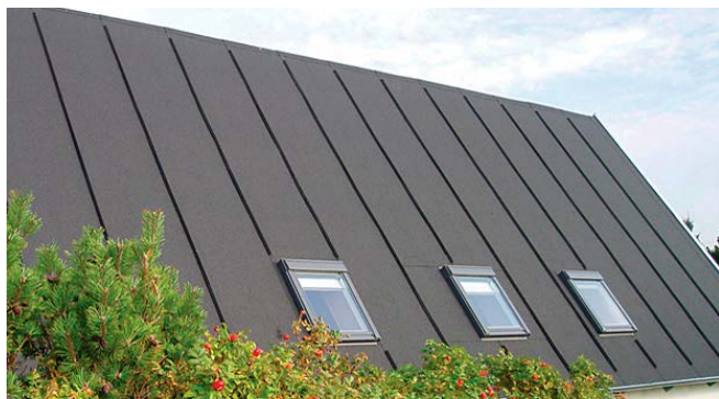
Isola Mestertekk med listedækning.