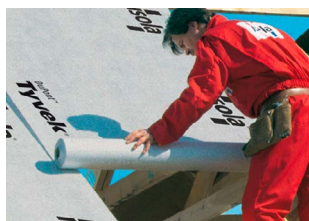
Isola Tyvek® Pro

Isola vedligeholdelses- og reparationsprodukter: Tagprimer, fugemasse, tagasfalt, murasfalt, Isoklæber samt tætningsmasse.