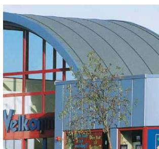
Isola Mestertekk m. listedækning.