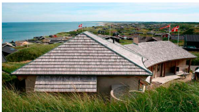
Tagspån i ubehandlet akacie.