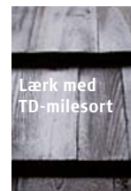
Lærk med TD-milesort