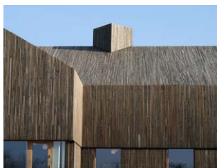
Tagspån ubehandlet Akacie.