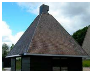
Tagspån forpatineret Akacie.