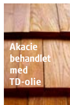
Akacie behandlet med TD-olie