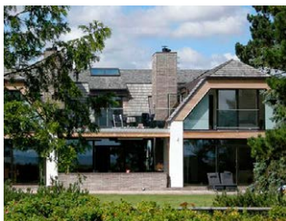
Tagspån forpatineret Akacie.