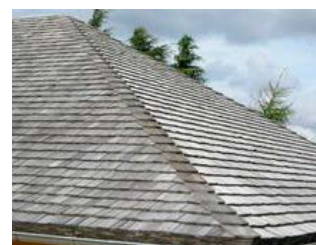
Tagspån ubehandlet Akacie.