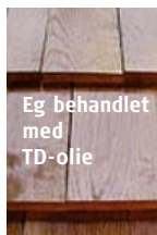
Eg behandlet med TD-olie