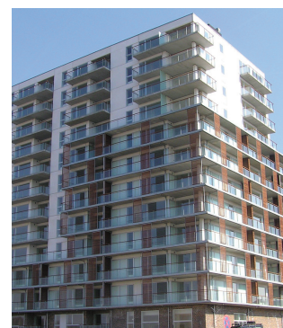
Altaner og terrazzotrapper. Ørestad 4A, Ørestaden.