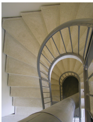
Terrazzotrapper, gelænder. Øresundshus.

Ligeløbstrapper, Kvartssvingstrapper og Halvsvingstrapper