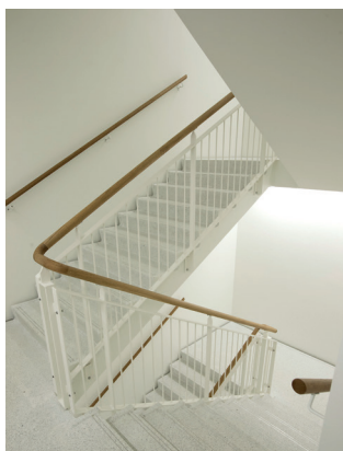
Terrazzo trappe, hvid norsk Calsit med alulister i trin forkant. Havneparken, Vejle.