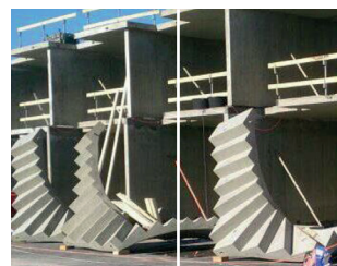
88 stk. 1/2 svingstrapper i grå beton til Artellerigården rækkehus.