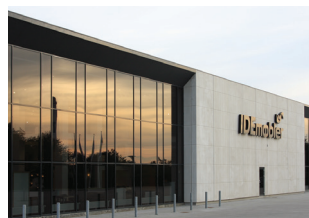
Facadeelementer. Idémøbler, Rønne.