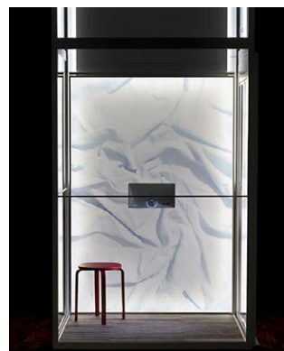
Aritco platformselevatore fås i et væld af farver og designs.